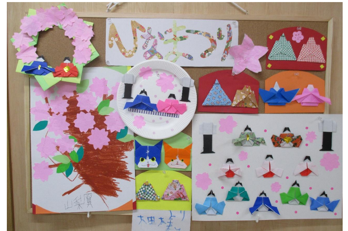
今月一枚 ラビット興津 ひな祭り